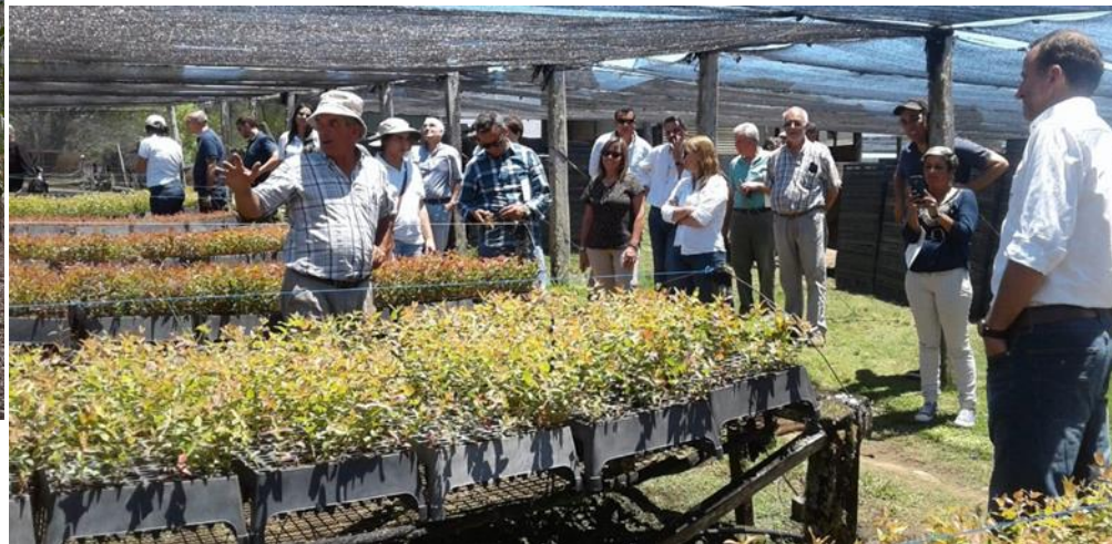
ACTIVIDAD EN EL MARCO DEL CECOPE