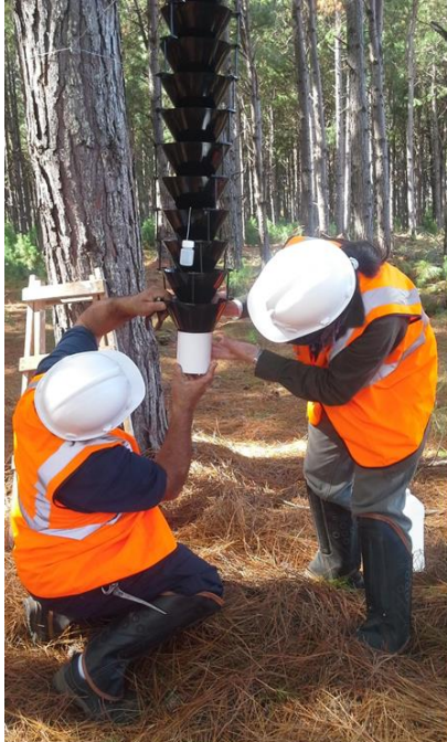
Monitoreo Nacional de Escarabajos de corteza y ambrosia