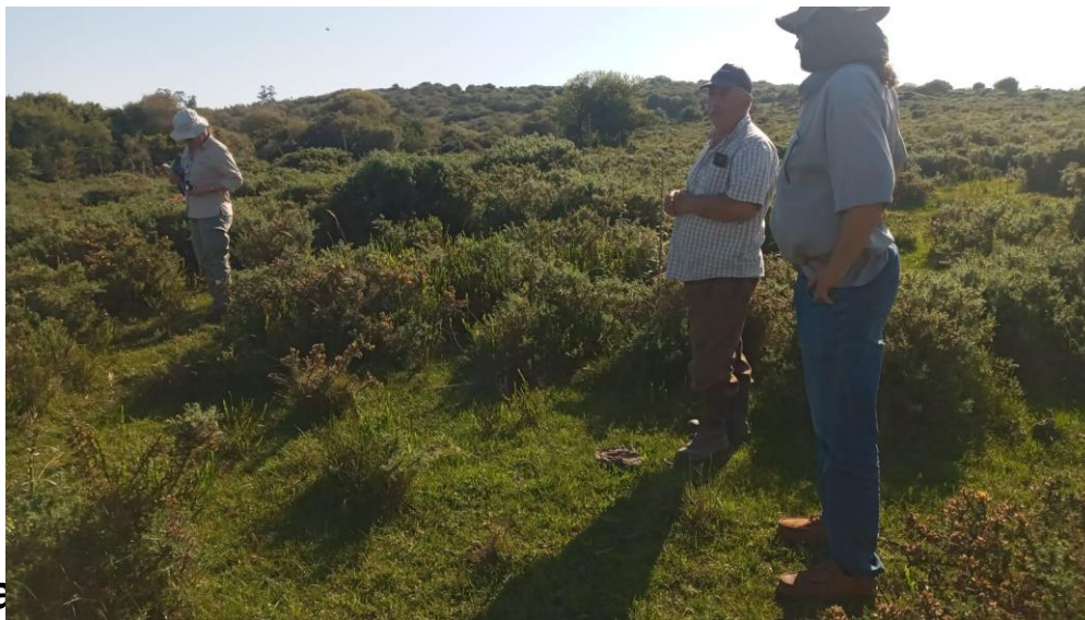
Proyecto FAGRO Sierras del Este Lavalleja