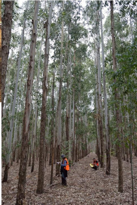
Prospecciones fitosanitarias en plantaciones forestales