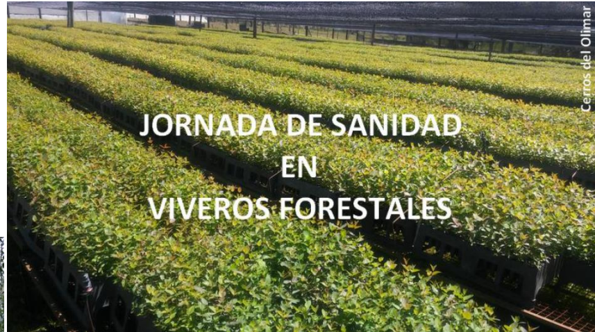
JORNADA DE SANIDAD EN VIVEROS FORESTALES