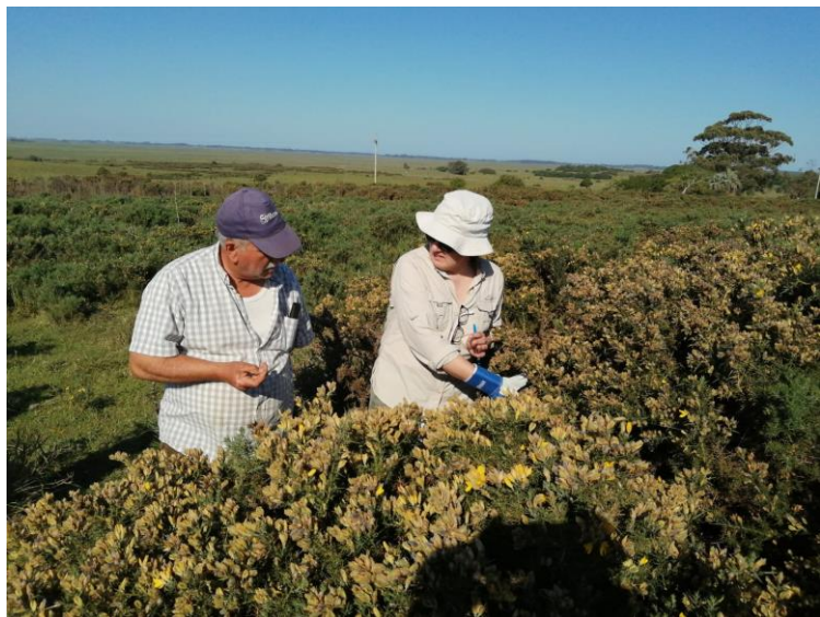
Plan Piloto CEEI - Potrero Grande - Rocha