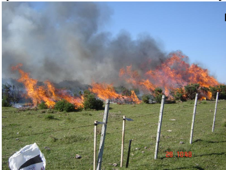
Plan de Manejo Área Protegida Sierra de Ríos Paso Centurión